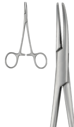
HALSTEAD-MOSQUITO cm 12