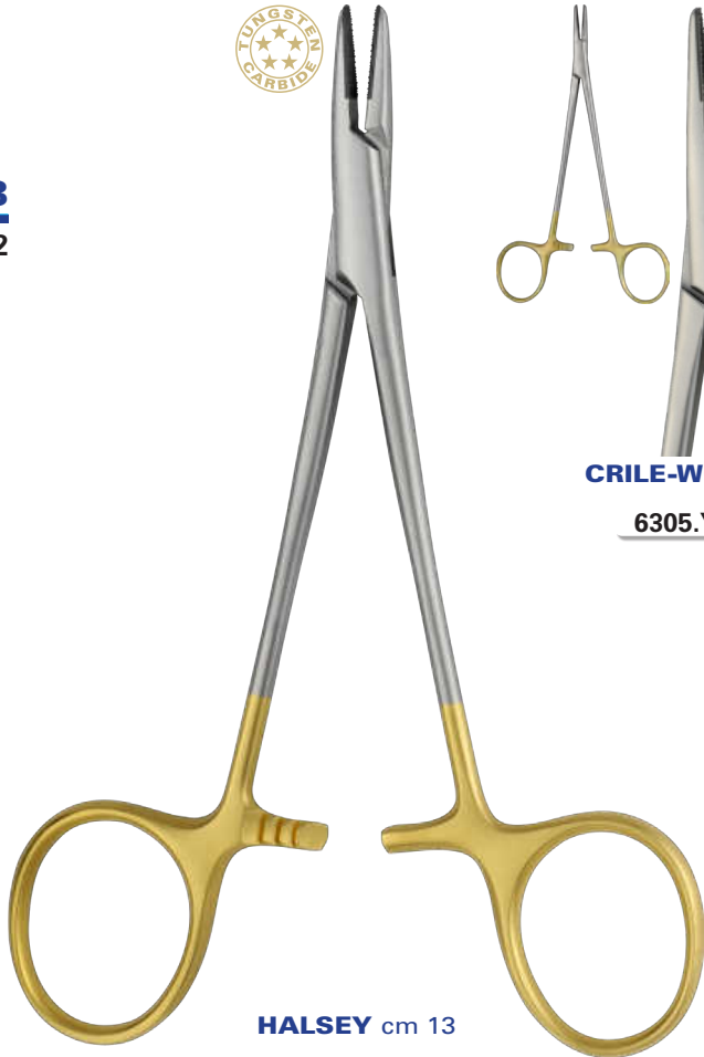
HALSEY cm 13