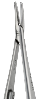
CASTROVIEJO cm 14