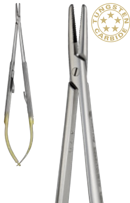
BARRAQUER - TROUTMAN cm 18