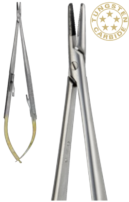
CASTROVIEJO cm 18