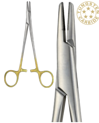
MAYO-HEGAR cm 16