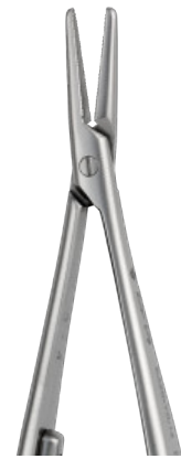
CASTROVIEJO cm 14