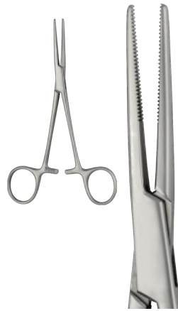
KELLY cm 14