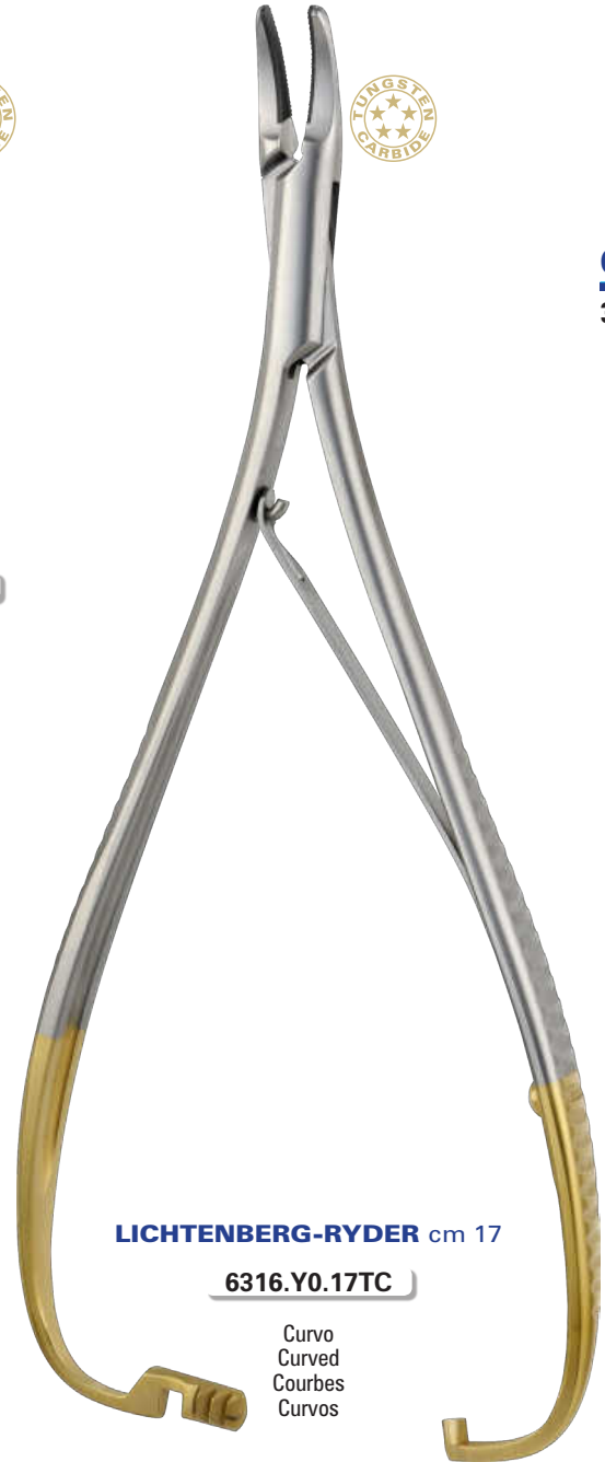
LICHTENBERG-RYDER cm 17