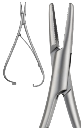
MATHIEU cm 14