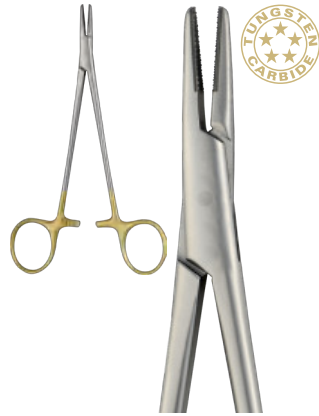
CRILE-WOOD cm 15