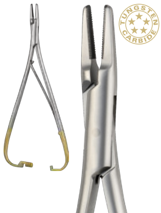
LICHTENBERG-RYDER cm 17