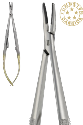
BARRAQUER cm 14