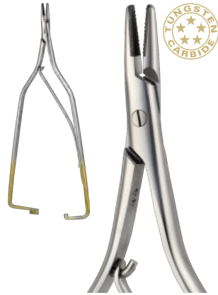
ARRUGA cm 15