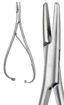
MATHIEU cm 17