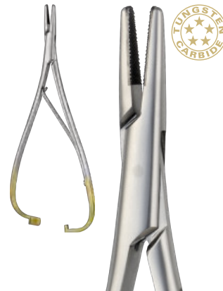
MATHIEU cm 17