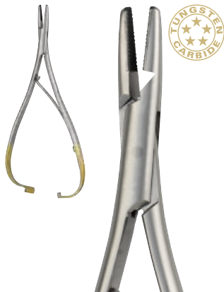
MATHIEU cm 14