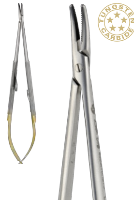
BARRAQUER cm 18